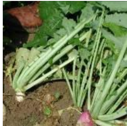
Accessione di Piana, Castiglione Del Lago

Anche l'orto invernale aveva una grande importanza. I re dell'inverno al Trasimeno sono i rapi: saporiti e produttivi, praticamente ogni famiglia con un orto aveva il suo seme tramandato dalle generazioni precedenti. Ora abbonda il seme commerciale, ma nella banca dell'Università ci sono ancora i vecchi campioni collezionati tempo fa e sicuramente autoctoni. È nostra intenzione rimmetterli in circolo.