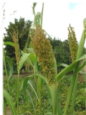
Accessione di S. Arcangelo.