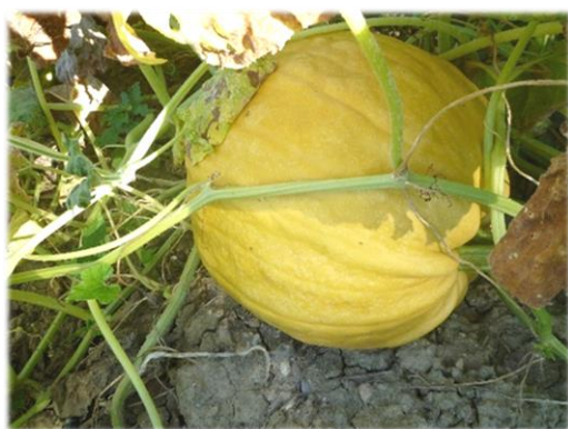
Accessione di S.Arcangelo.