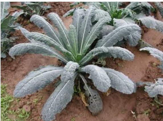
Accessione di Piana

Varietà che viaggiavano in Toscana c'erano anche qui, terra di confine. Non si faceva la ribollita, ma il cavolo nero si consumava tutto l'inverno, foglia dopo foglia. Preziosissimo per dare carattere alle zuppe.