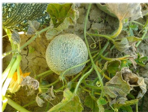
Accessione di Vernazzano.