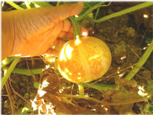
Accessione 7 Frati, Pietrafitta