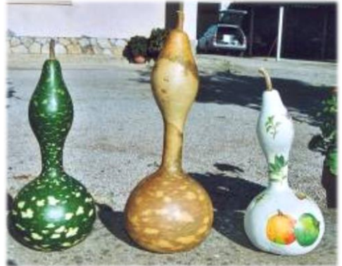
Accessione di Sanguinetto.

Le zucche nell'orto familiare avevano molti usi: come contenitore di acqua da tenere fresca per il lavoro nei campi o per i pellegrinaggi, come lanterne, come ornamento, per pergolati... la zucca con le sue mille forme aveva sempre un posto nell'orto.