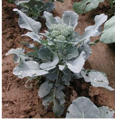
Accessione di Piana, Castiglione Del Lago

E per finire, una rarità : un cavolo a palmetta, parente del cavolo nero, che come il cavolo nero non fa la testa ma ha foglie glauche, grigio chiare.