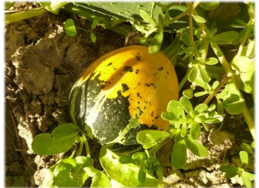
Accessione 7 Frati, Pietrafitta