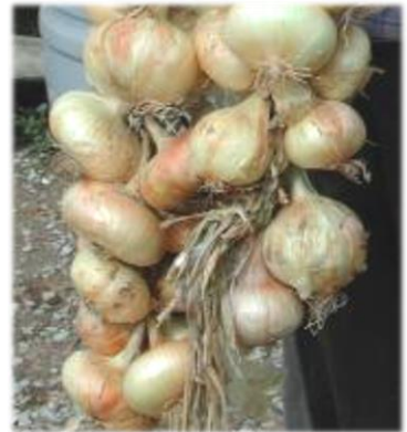
Accessione di Castiglione Del Lago