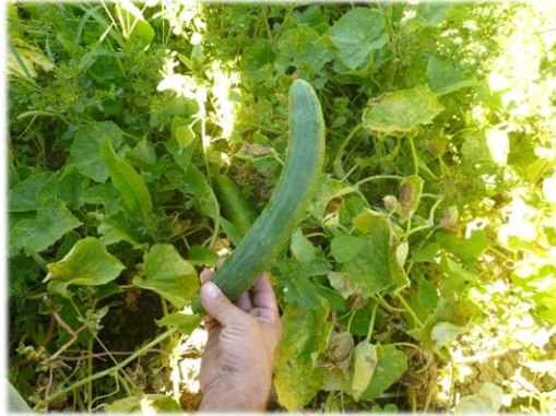
Accessione di Vernazzano.