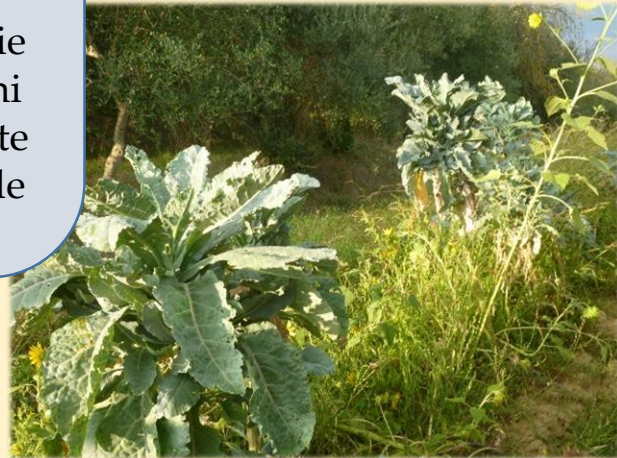
Accessione di Vernazzano.

È conosciuto in Brasile e Portogallo, dove si usa per piatti tradizionali, ma in Italia è rarissimo, ci sono solo un paio di varietà locali nel centro-Sud.