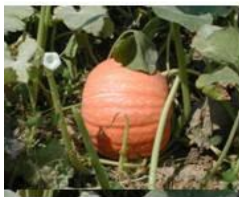
Accessione di Vernazzano