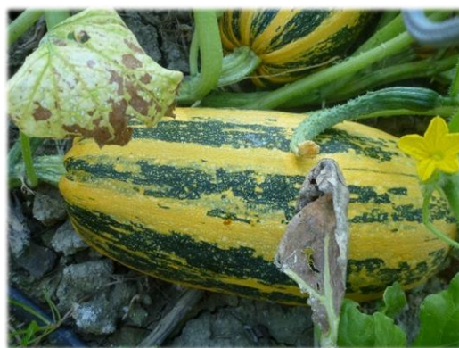
Accessione di Vernazzano.