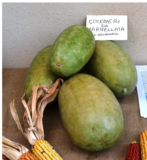
Accessione di S. Arcangelo.

Il cocomero da marmellata è bianco, croccante, ricco di pectine, si usava una volta per addensare le marmellate di altri frutti.