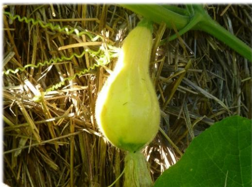
Accessione 7 Frati, Pietrafitta