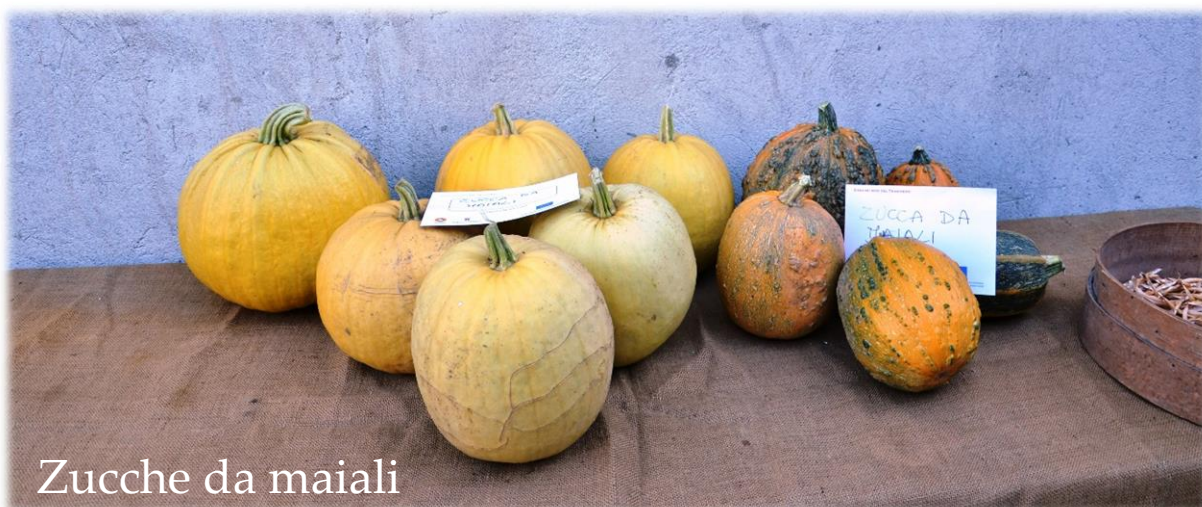
Zucche da maiali